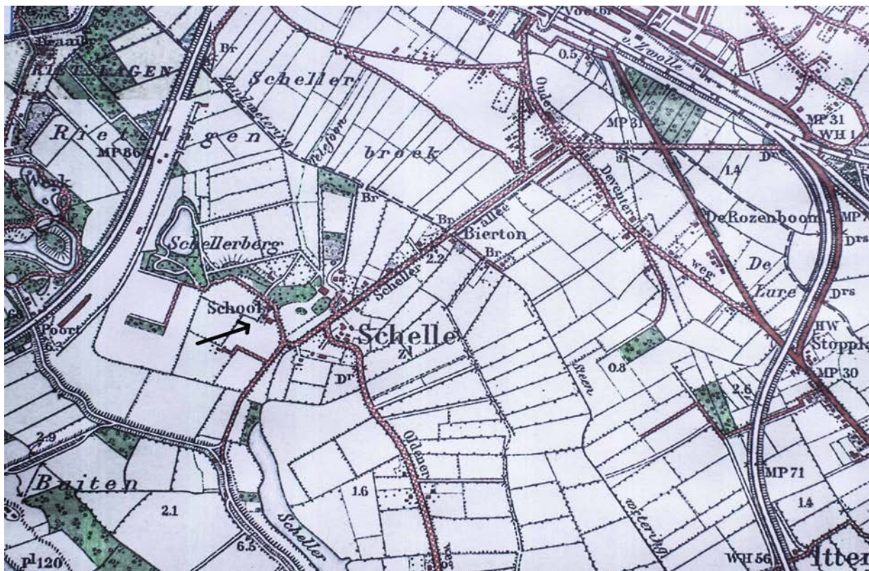
Kaart van Schelle van 1920. Bij de pijl de locatie van de nieuwe boerderij vlakbij de school.