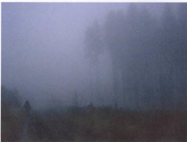
Mist in de Harz

Dat vervolg zou nog drie jaar duren, want wandelroutes naar het zuiden kregen onze prioriteit. We kwamen er toen achter dat de E11 niet of nauwelijks is bewegwijzerd. Wel ontdekten we dat de Wittekindsweg ons verder naar het oosten zou brengen. Dit gemarkeerde pad loopt van Osnabrück naar Porta Westfalica aan de Wezer. In de herfst van 2004 liepen we over dit pad vijf dagen lang door het bos over de kam van het Wiehegebirge. Daar hielden de officiële wandelpaden op en in de herfst van 2006 volgden we de E11 zo goed en zo kwaad als het ging aan de hand van topografische kaarten. Via Hamelen en Alfeld bereikten we in de herfstvakantie van het jaar daarop de Harz. Dat gebied heeft een enorm wandelnetwerk, maar onze route liep langs de noordflank van het gebergte via Goslar, Bad Harzburg en Blankenburg naar Thale. Het was mistig die dagen, de Brocken bleef in nevelen gehuld. Dat deed ons afzien van een klim naar deze hoogste berg van de Harz, waar Goethe veel inspiratie opdeed.