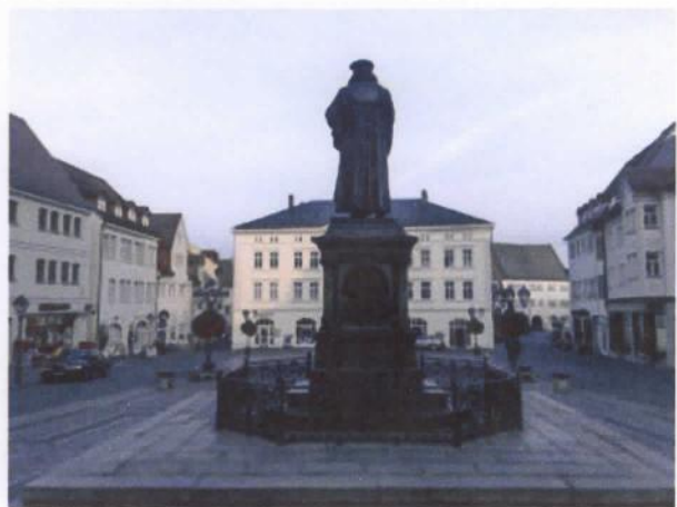
Luther kijkt neer op zijn geboorteplaats