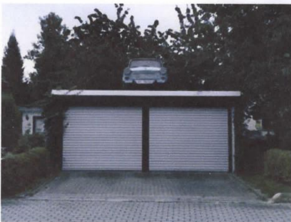
De enige Trabant die we onderweg zagen

Wij pakten de route op in Merseburg ten zuidoosten van Halle. We hadden via de website www.oekumenischer-pilgerweg.de de wandelgids besteld met daarin een routebeschrijving en overnachtingsadressen. Perfect georganiseerd allemaal. Er was alleen een probleem. De routebeschrijving en ook de bewegwijzering was van oost naar west, het was immers een aanlooproute naar Santiago, maar wij liepen van west naar oost. Dat maakte veelvuldig raadplegen van de inmiddels digitale kaarten noodzakelijk (maps.me en vooral kompass.de, waarop de pelgrimsroute ook was aangegeven). Dit nadeel had ook een voordeel. Je ontmoet zo veel meer pelgrims onderweg.