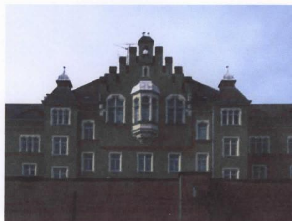
Stasi gevangenis in Bautzen