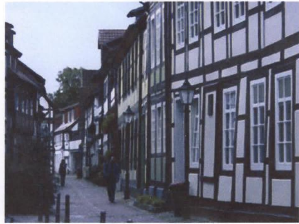
Straatje in Hamelen

Dat vervolg zou nog drie jaar duren, want wandelroutes naar het zuiden kregen onze prioriteit. We kwamen er toen achter dat de E11 niet of nauwelijks is bewegwijzerd. Wel ontdekten we dat de Wittekindsweg ons verder naar het oosten zou brengen. Dit gemarkeerde pad loopt van Osnabrück naar Porta Westfalica aan de Wezer. In de herfst van 2004 liepen we over dit pad vijf dagen lang door het bos over de kam van het Wiehegebirge. Daar hielden de officiële wandelpaden op en in de herfst van 2006 volgden we de E11 zo goed en zo kwaad als het ging aan de hand van topografische kaarten. Via Hamelen en Alfeld bereikten we in de herfstvakantie van het jaar daarop de Harz. Dat gebied heeft een enorm wandelnetwerk, maar onze route liep langs de noordflank van het gebergte via Goslar, Bad Harzburg en Blankenburg naar Thale. Het was mistig die dagen, de Brocken bleef in nevelen gehuld. Dat deed ons afzien van een klim naar deze hoogste berg van de Harz, waar Goethe veel inspiratie opdeed.