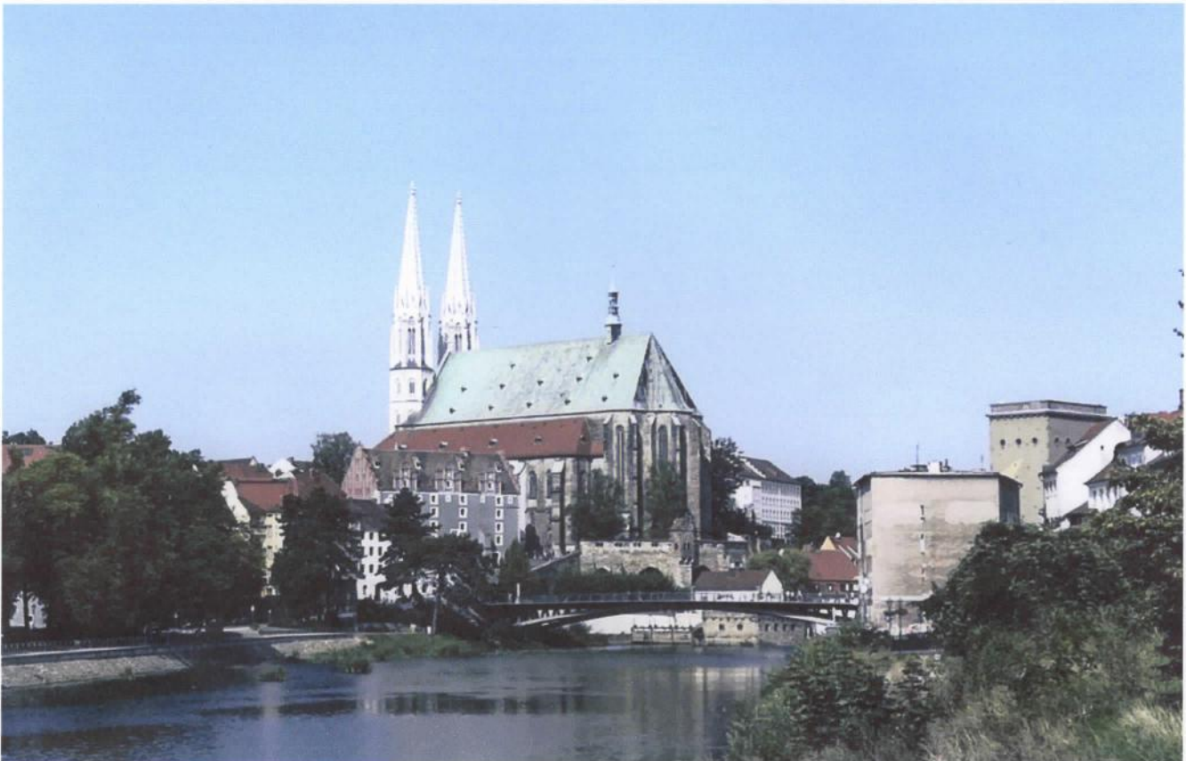
Peterskirche in Görlitz aan de Neisse

De route leidt je langs leuke oude stadjes zoals Merseburg, Bautzen en Görlitz met Leipzig als grootste stad. In die plaatsen zijn ook veel toeristen, maar die zie je niet onderweg, waar de route veel over onverharde wegen gaat en door kleine dorpjes, waar meestal wel basisvoorzieningen aanwezig zijn. Het landschap is glooiend en de route volgt vaak riviertjes. Het hoogste punt is ca. 300 meter in de buurt van Königstein, vlak voor ons eindpunt Görlitz aan de Poolse grens, dat eigenlijk het beginpunt van de Pilgerweg is.